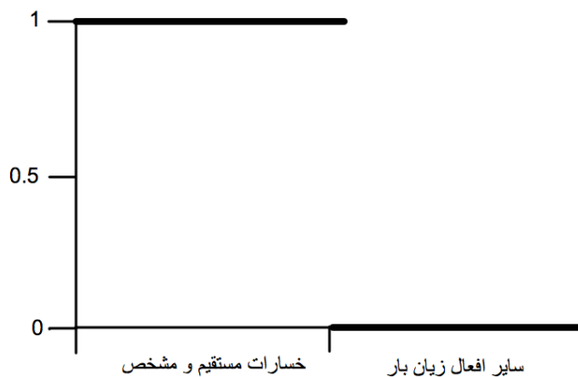
تصویر ۲. طرح شماتیک درجه‌بندی ارزش‌ها در منطق دووجهی

در حقیقت، در منطق فازی، درست بودن یک گزاره، به صورت درجه‌بندی تعریف می‌شود و درست و نادرست بودن آن محدود به صفر (به معنای نادرست) و یک (به معنای درست) نیست. بلکه، درستی یا نادرستی گزینه‌ها در یک محدوده‌ای از ارزش‌های دنباله‌دار بین صفر (کاملاً غلط) تا یک (کاملاً درست) تعریف می‌شوند (Delmas-Marty, 2000: 773). این تحلیل در طرح‌های شماتیک زیر مشخص‌تر می‌شود.